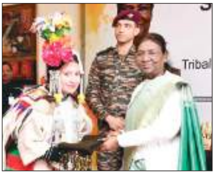
राष्ट्रपति द्रौपदी मुर्मू ने कहा कि लद्दाख में आध्यात्मिक, एडवेंचर, इको और स्वास्थ्य पर्यटन से जुड़ी अपार संभावनाएं हैं।